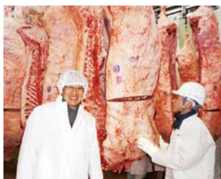
“安心・安全”な商品しか扱いません!