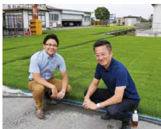
周りの環境などもしっかり確認。

当社スタッフが仕入先の産地や工場に伺い、 自分たちの目で商品の品質・衛生状態の確認を行っております。 お客様に喜んでいただける“安心・安全”な商品だけを扱わせていただいております。