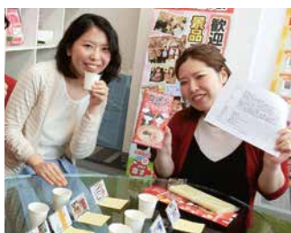
実際に調理し、“品質・味・鮮度”などをチェックしています。

商品の“試食会”を定期的に設け、食品の“品質”や“味”のチェックを実施しています。 美味しいものを厳選し、納得できる商品だけをお届けさせていただいております。