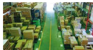
自社倉庫から商品を直接確認!