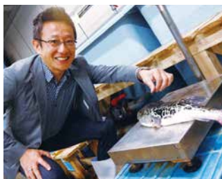
商品にはこだわりがあります!