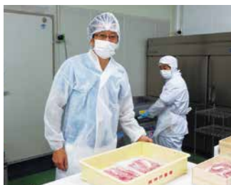
品質管理の工程もチェック。