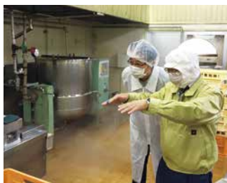
定期的に“視察”に伺っています。