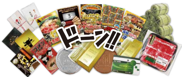
幹事様のニーズに対応するオリジナル景品を考案。

イベントを盛り上げる 新しい景品やアイデア景品の 仕入先・パートナー企業様を 随時募集しております!