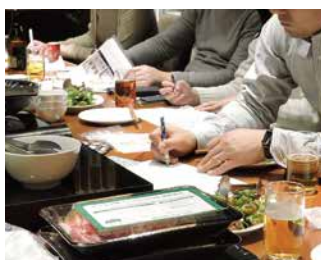
チェックシートで細かく確認。